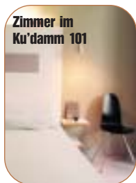
Zimmer im Ku'damm 101