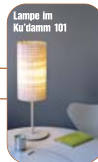
Lampe im Ku'damm 101