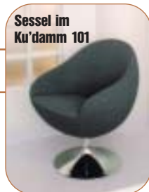
Sessel im Ku'damm 101