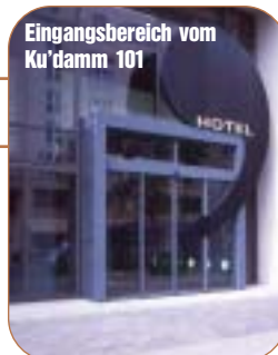
Eingangsbereich vom Ku'damm 101