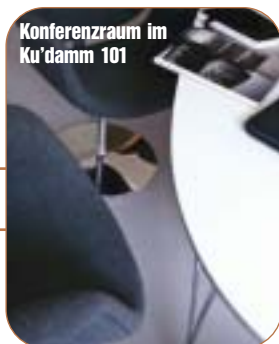
Konferenzraum im Ku'damm 101